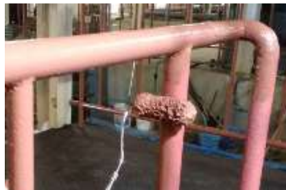
仕上げ塗装による違い