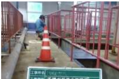
下塗り作業の実施

処理施設内にあるポンプ槽・ばっき槽・沈殿槽等各槽の周辺を囲む落下防止手すりの塗装が劣化していたため、事故防止のためにさび止め塗装を実施しました。手すりの総長361m、支柱・防止棒等すべて含めると塗装は1,711mにおよびました。