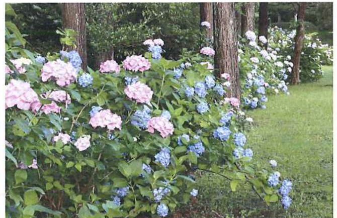
中央公園に咲く