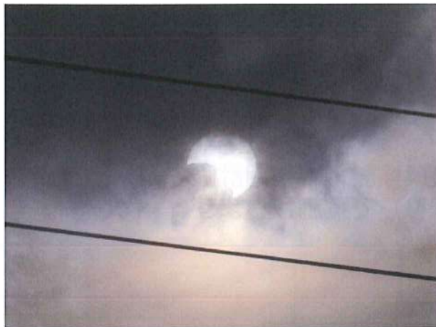
6月21日 夏至の日食は372年ぶり