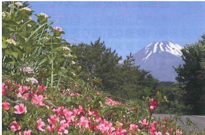
梅雨入り直前の夏富士