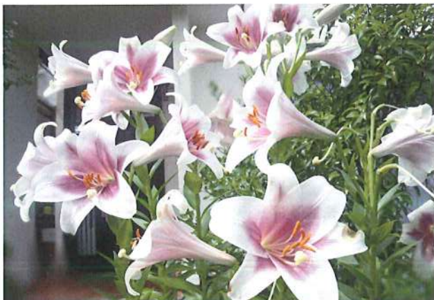
7月13日の誕生花

*管理組規約一部変更、区内諸事関連規約の両案は完成次第、皆様のご意見、ご指導を頂いてから各臨時総会を経て発効することになります。また、横断的機能の自治会会則案も皆様のご意見、ご指導を経て、両臨時総会にて説明させていただく予定です。