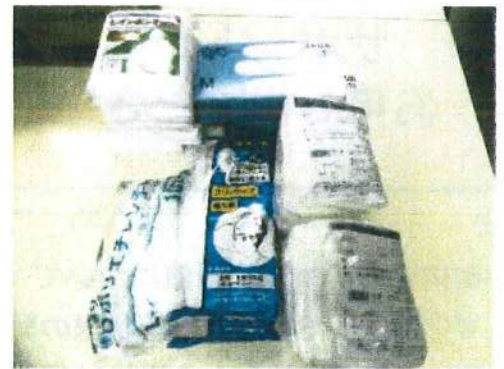
使い捨て手袋、合羽、 ヘルメットインナーキャップ