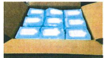
アルコール含有 ウェットシート