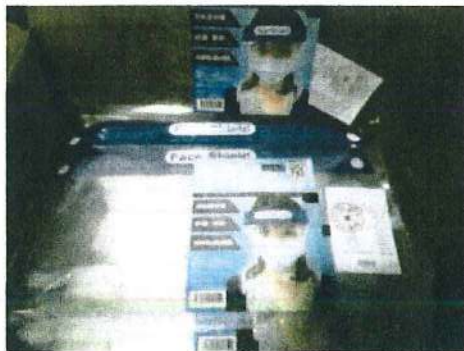
フェイスシールド (委員はこれを着用して対応します)