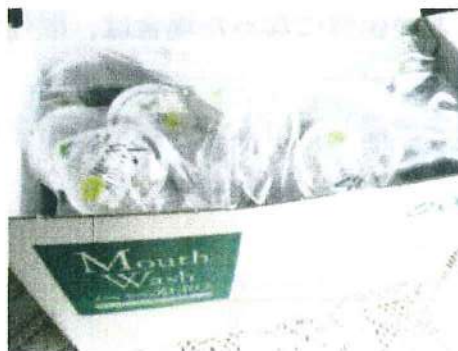
口腔洗浄剤 (歯ブラシがなくても 口の中を清潔に)