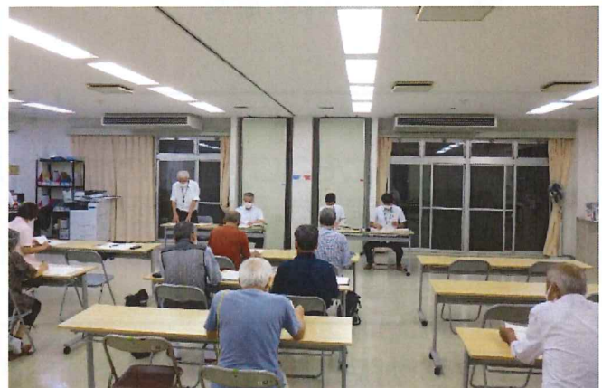
みらい政策課長からの説明