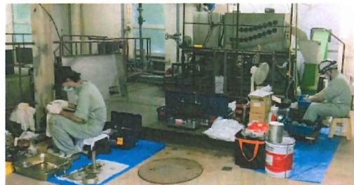
脱水機のオーバーホール作業