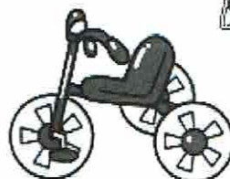
・子ども用三輪車 ・一輪車など