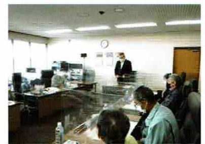
審議会の様子（第1回）