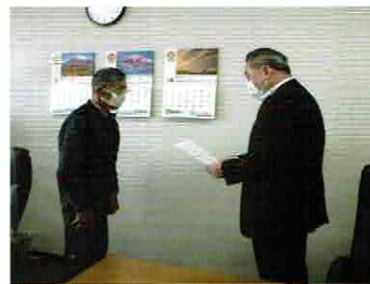
市長からの諮問 (令和3年10月14日)