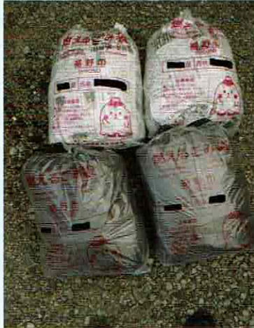
新聞紙（上段） 黒ビニール袋（下段）