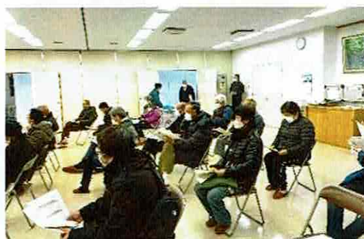
説明会に参加された皆さん

市内バス路線の空白地帯に対し、公共交通ネットワーク計画予定として、千福が丘から裾野駅までのルートが検討されています。月曜日・火曜日・木曜日の週3日、1日3便の運行、運賃体系は距離別となる予定です。