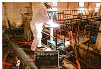
1月 移流水路ゲートバルブの交換