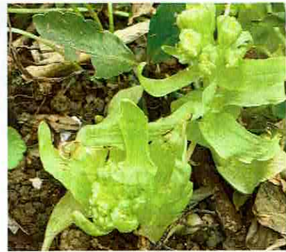
春の味覚フキノトウ