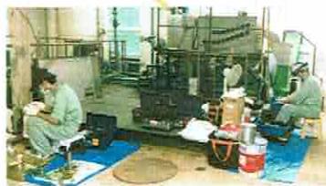
8月脱水機オーバーホール を実施