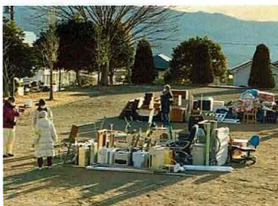
仕分けされた粗大ゴミ

1月15日に今年度2回目の粗大ゴミ収集を行いました。前回(7月)は悪天候のためゴミを出せなかった人が多かったためか、今回は多くのゴミが集まりました。