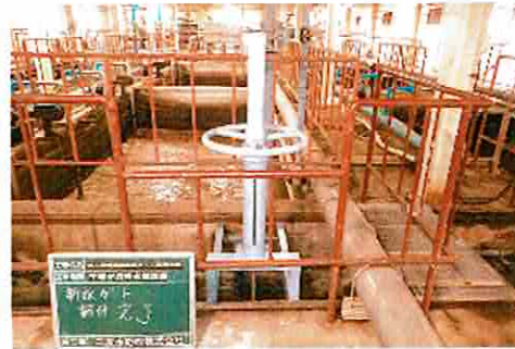
交換工事、完成確認