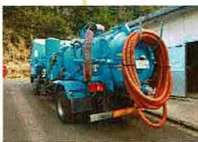
1月強力吸引車で 沈砂槽から沈砂を回収