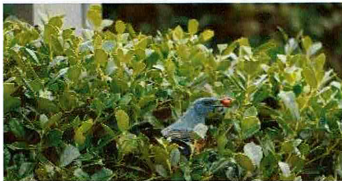
赤い実を食べるイトヒヨドリ