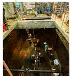
11月第1沈殿槽 更新工事完了