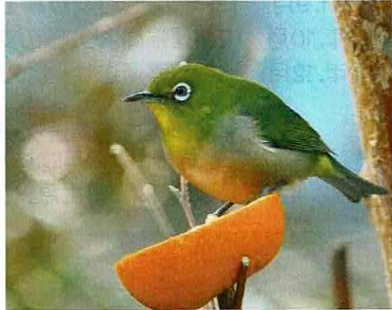
庭先で食事中のメジロ