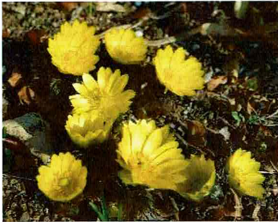
立春のころのフクジュソウ