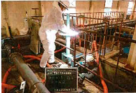
ゲートバルブの交換工事

汚水処理場の曝気槽移流水路ゲートの改修工事を1月17日から19日に行いました。移流水路ゲートは曝気槽と沈殿槽を繋ぐゲートバルブで、処理水の流れを制御する設備です。老朽化で機能不全に陥っていたため解体し交換しました。