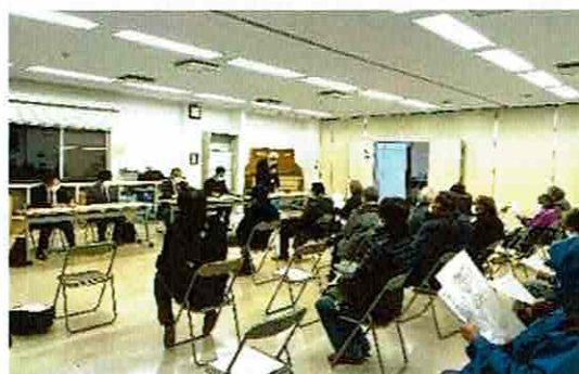
市役所みらい政策課の説明