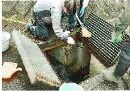
鉄格子に付着した泥の除去