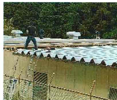
変形スレート板の交換