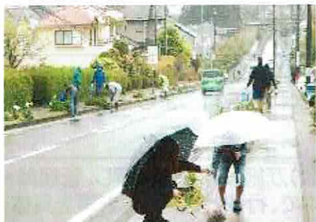
中央通り両サイドでの清掃