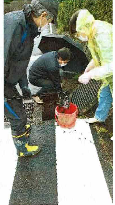
泥の掻き出しと運搬の連携