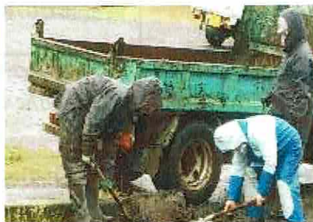
業者による土砂の回収

□ 会館横の樹木剪定：4月9日(土)～12日(火)の4日間(午前8時～午後5時)