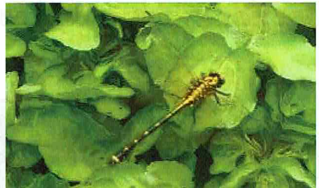
ヤマサナエ 姿がオニヤンマに似ています(柿田川水域で観察)