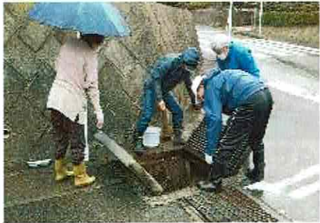
蓋を開けて堆積土砂を確認

雨の中、多くの方の参加を得て、雨水枡や側溝からの泥の掻き出し、鉄格子周辺の清掃、土砂のゴミ分別及び土砂集積場所への移動などを手際良く行っていただきました。ご協力、ありがとうございました。