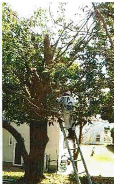
アカガシの伐採・枝打ち