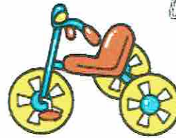
・子ども用三輪車 ・一輪車など