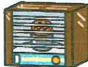
・ベビーカー ・スチール机 ・ストーブ