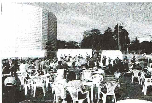
今年度のふれあい広場開催は、11/20（日）を予定しています。参加団体：約40団体