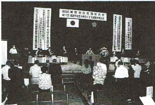
社会福祉への尽力者に対する顕彰並びに福祉講演会の開催。また、静岡県健康福祉大会へ参加。