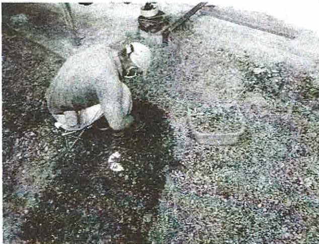
高齢者や障害者など、暮らしの中でちょっとした困り事がある家庭に対し、会員制による支え合いのサービス。