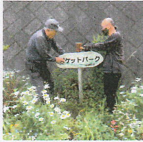
看板の修理と設置を行いました