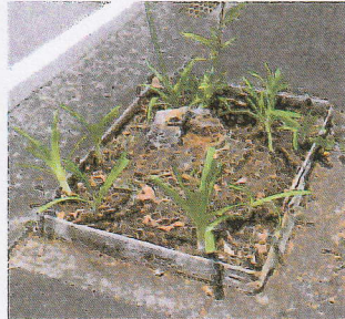
メイン道路樹花壇にアガパンサス苗を植えました