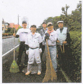
メイン道路の草刈りと手入れを行いました