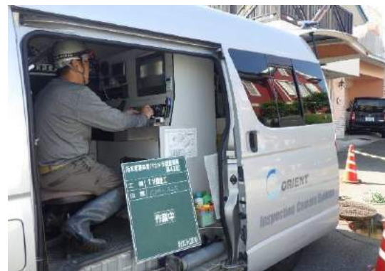
カメラ情報を監視記録する