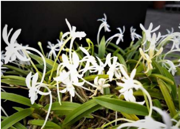
日本原産のラン科植物フウラン