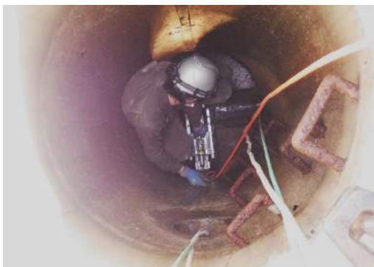
マンホール内にカメラをセット