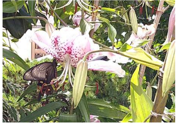
コリに蜜を求めて