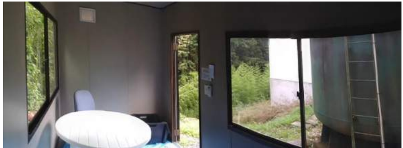
処理場東側に設置された休憩所