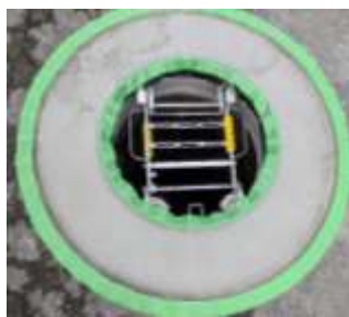
マンホール外周の補強