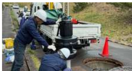
第二中継ポンプ場No.2ポンプ点検