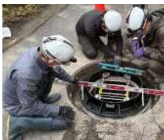
交換枠の取付加工