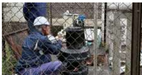
第一中継ポンプ場 ポンプの塗装処理

予防保全につとめ、今後の安定した稼働のために異音・振動・漏電・腐食の確認、運転状況のチェック、清掃とポンプ本体への再塗装を行いました。