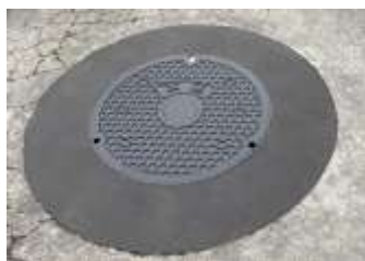
交換後マンホール 表層には樹脂モルタル