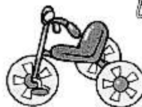
・子ども用三輪車 ・一輪車など