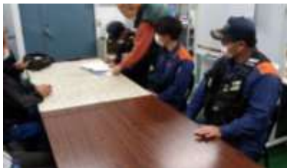
管理組織について説明

消防法第4条の規定に基づき、裾野消防署による汚水処理場の立入検査が行われました。汚水処理場に設置している消火器の位置や管理状況、建物の構造等に問題がないことを確認しました。