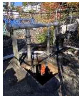
第一中継ポンプ場ポンプ