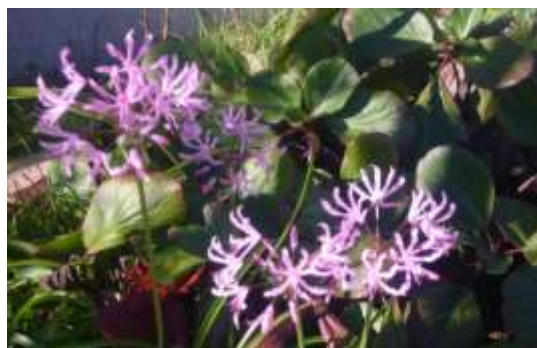
ダイヤモンドリリー