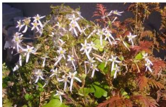
ダイヤモンドソウ