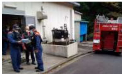
処理棟について書面確認