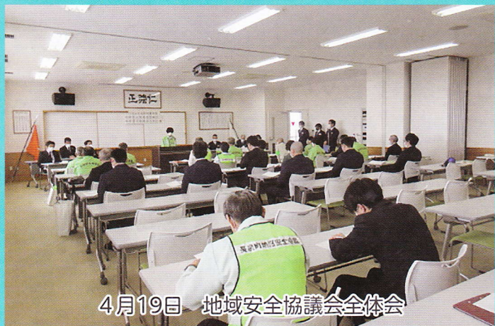
4月19日 地域安全協議会全体会