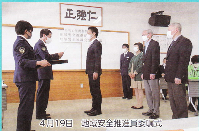
4月19日 地域安全推進員委嘱式