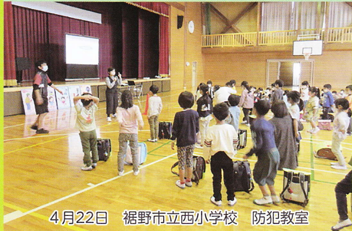
4月22日 裾野市立西小学校 防犯教室