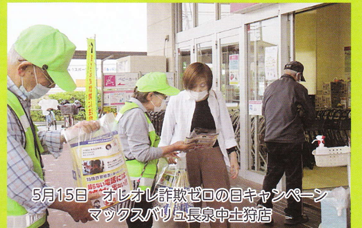
5月15日 オレオレ詐欺ゼロの目キャンペーン マックスバリュ長泉中土狩店