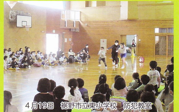
4月19日 裾野市立東小学校 防犯教室