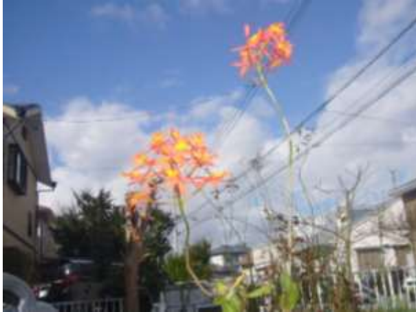
可憐な美 エピデンドラム