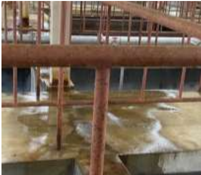
手摺り錆止め塗装

汚水処理施設を将来に渡って維持し、安全に運転していけるように、2023年度には以下の補修工事を計画しています。