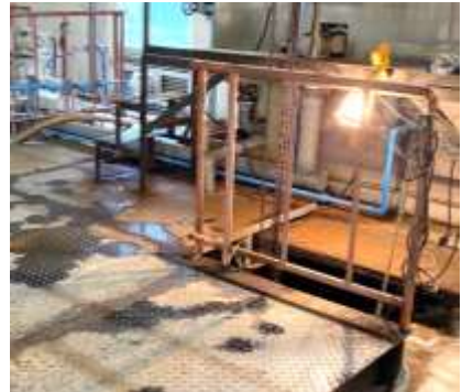
脱水機まわり縞鋼板 修繕