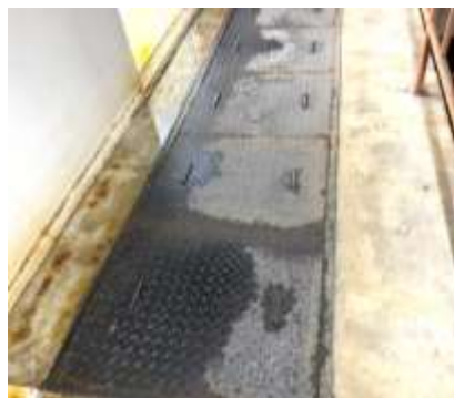
縞鋼板 錆止め塗装