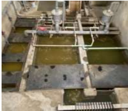
沈砂槽手摺り取付け