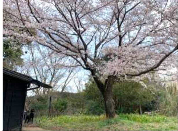
地球人村 長寿のサクラ