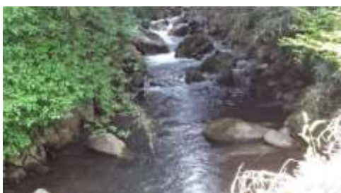
処理場わきから見る谷津川