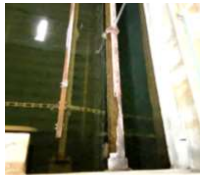
第2沈殿槽スカム除去装置交換