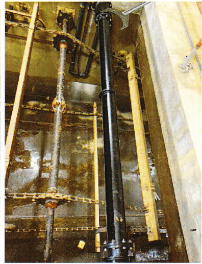
交換後のスカム除去装置