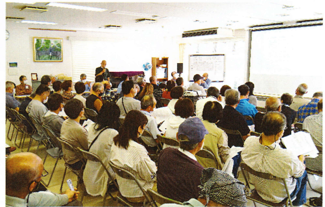
総会当日の会場のようす

第1号議案から第4号議案(1)までの各議案はそれぞれの可決要件を満たし、原案どおり承認可決されました。また、第4号議案(2)は当日議場で投票を行い、理事を選任しました。