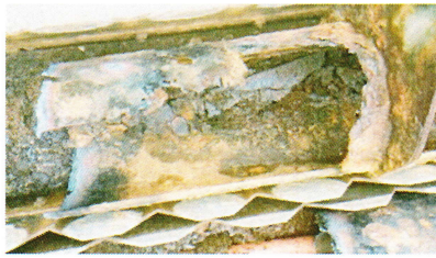
腐食した越流トラフ

最終沈殿槽内に設置されているスカム除去装置等の腐食損傷個所の補修工事を実施しました。