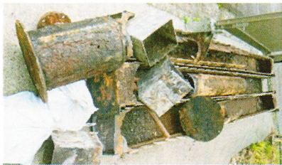
腐食したスカム除去装置