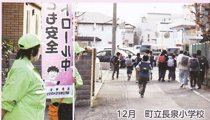
12月 町立長泉小学校