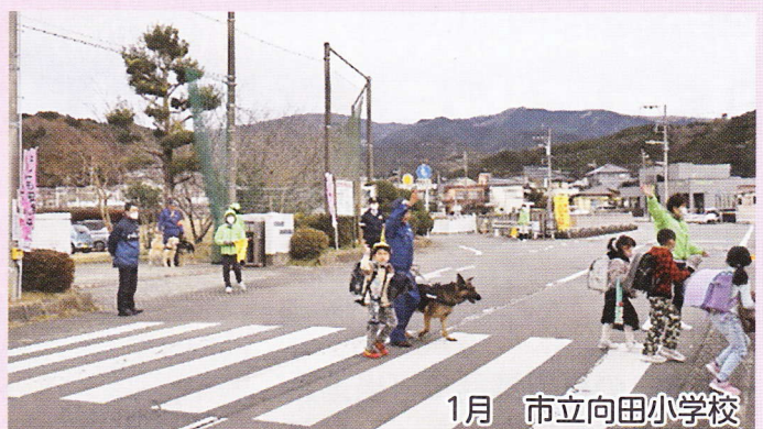
1月 市立向田小学校