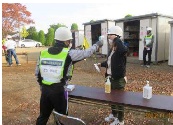
非接触型体温計、消毒液を設置