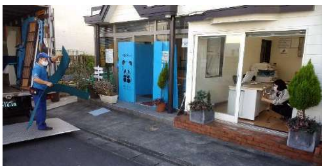
旧事務所から荷物を搬出

12月4日は引越し作業のため臨時休業をさせていただきました。新事務所での窓口は12月7日より開けております。