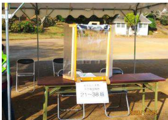
受付には飛沫感染防止のシールド