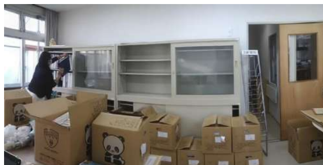
新事務所の荷物整理