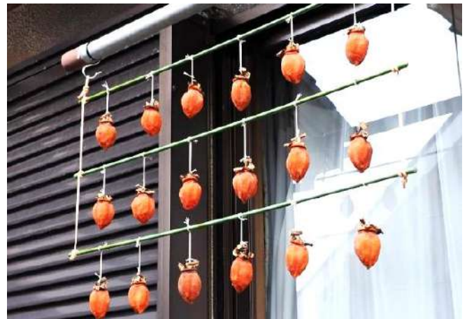
晩秋の楽しみ：干し柿