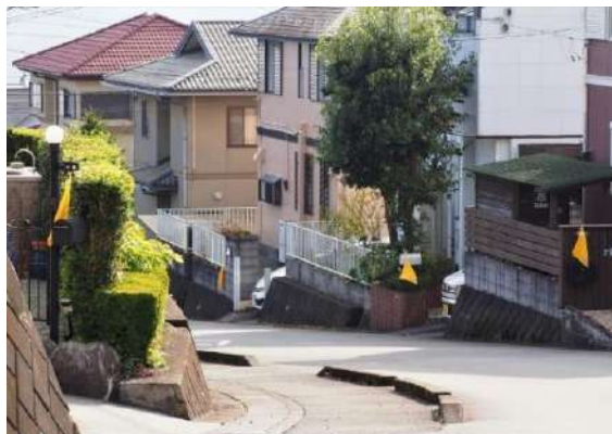
住民各戸安否確認表示(黄色の旗)

例年秋の防災訓練は、住民の安否確認、中央公園へ移動、消火訓練や炊き出し等のイベントを行っていましたが、コロナ禍の為、防災組織機能の確認ならびに住民の方の安否確認のみを実施しました。