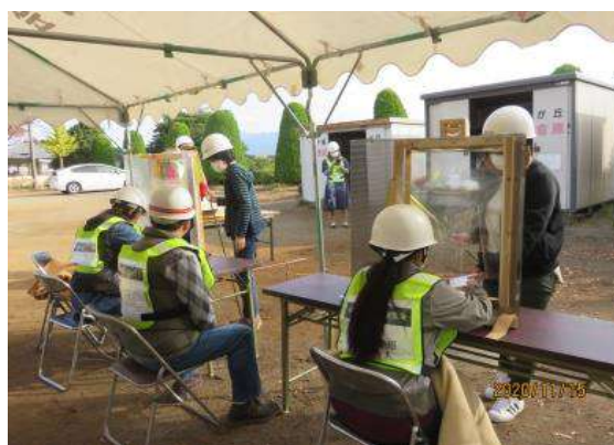
防災組織への安否確認報告