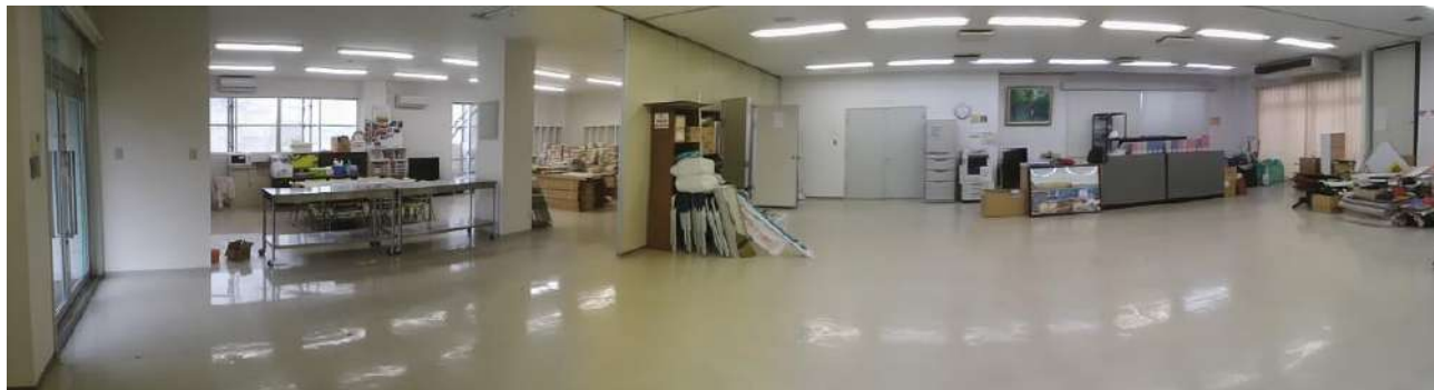
間仕切りを開放すると大きなフロアとなり、多目的に利用できます