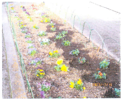
会館西側花壇にパンジーを植えました