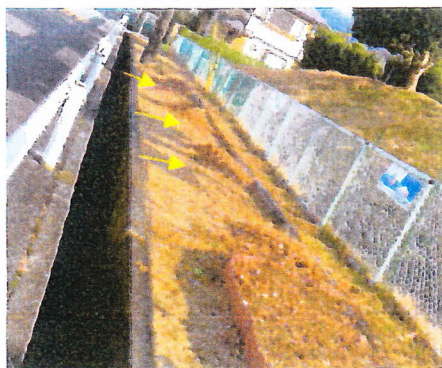
中央公園フジバカマ花壇の 落ち葉集め(矢印部分)