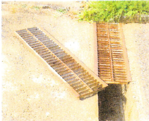
なかよし公園側溝掃除