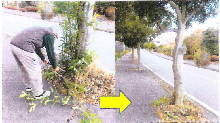
マテバシイのひこばえ手入れ