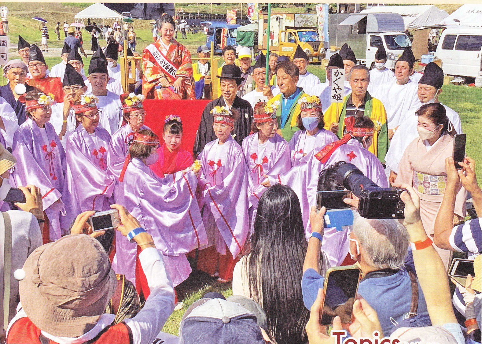
昨年のお祭りの1コマ