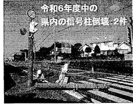
安全が脅かされている