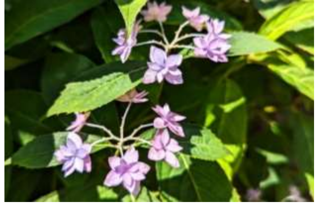
千福が丘に咲く、原木紫陽花

5月19日に開催された第34回千福ニュータウン団地施設管理組合総会は無事終了しましたこと、ご報告いたします。