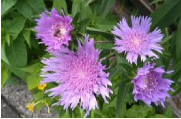
ハチを誘うステキシア