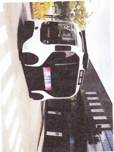
ご参考：e-Palette 車両イメージ写真