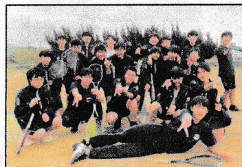
男子ソフトテニス部