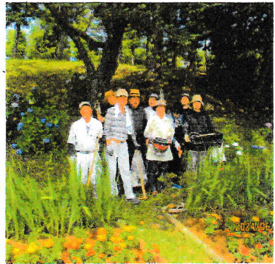
中央公園花壇にマリーゴールド とサルビアを植えました 紫陽花も綺麗に咲いています