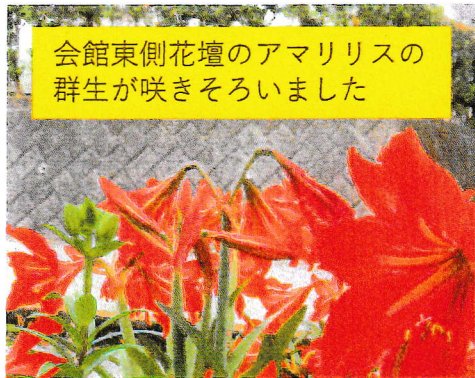
会館東側花壇のアマリリスの 群生が咲きそろいました