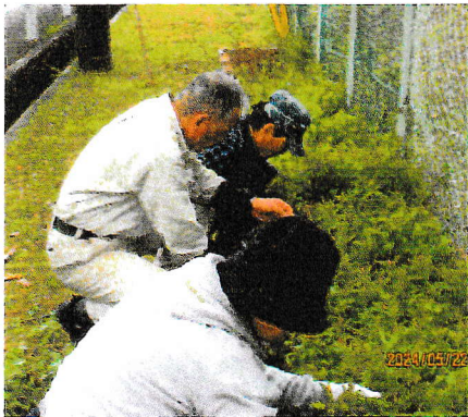
フジバカマ花壇の草刈りと草取り 手入れを行いました