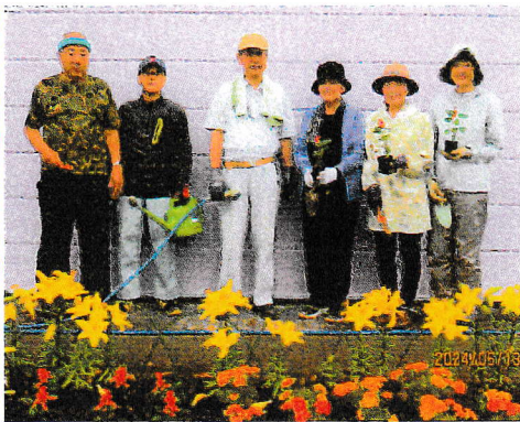
会館西花壇にマリーゴールドと サルビアを植えました