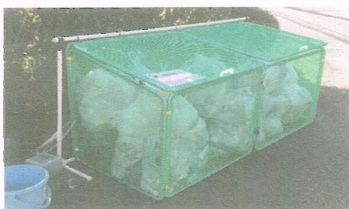
【組み立て状態(支柱・ブロックあり)】