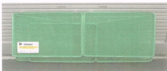
【折り畳み状態(単体)】