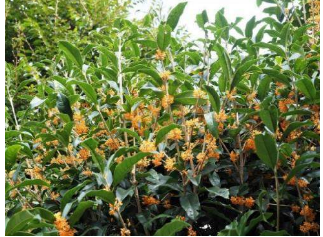
匂い香るキンモクセイ