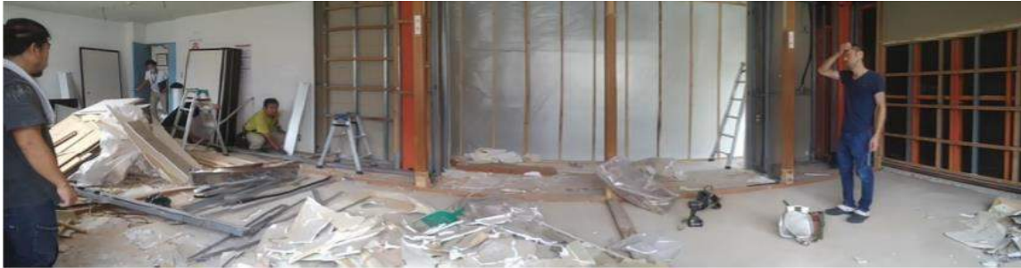
壁を取り払い、床面を整える