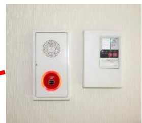
非常通報機器は玄関 ホールへ移動しました