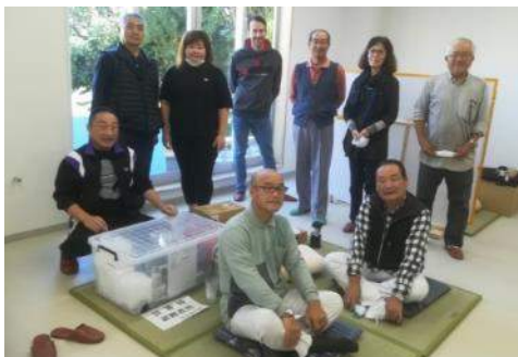
自主防災委員のメンバー お疲れさまでした！