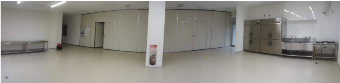
ワンフロアの広いスペースになりました