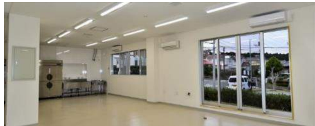
外壁との間に断熱材を投入、掃き出し窓を設置