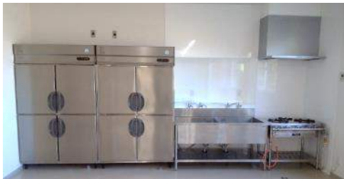
冷凍冷蔵庫の設置