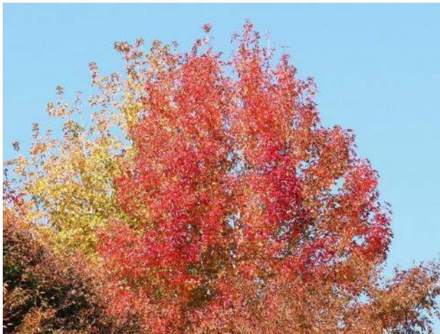
紅葉したメイプル