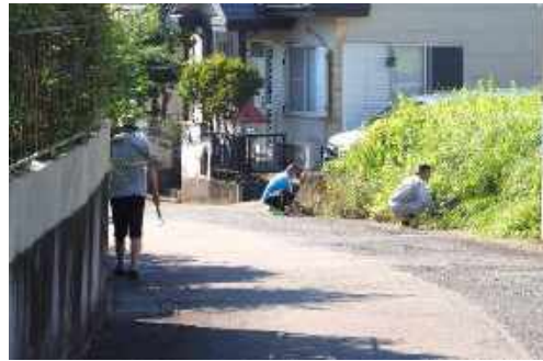
空地の除草も協力して作業