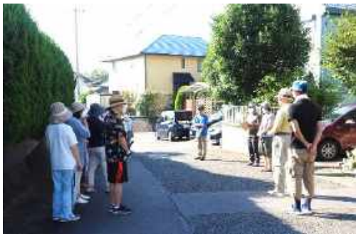
「熱中症に気をつけて」 班長より

裾野市きれいなまちづくり推進事業の一環として、夏の一齐清掃が行われました。 住民の皆さんの協力のもと、自宅の除草とほかに、隣接道路の除草等を実施しました。