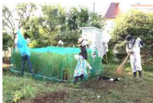
日頃の技を駆使してきれいに剪定・除草