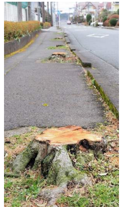
伐採された切株群