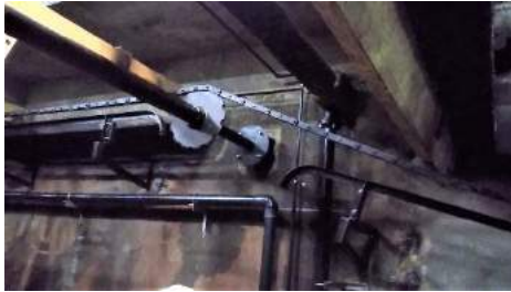
交換後の掻寄機上部

三つある第一沈殿槽の老朽化対策として一つの沈殿槽の掻寄機補修工事を実施、1月25日より稼働しています。 来年度も一つ行う予定です。