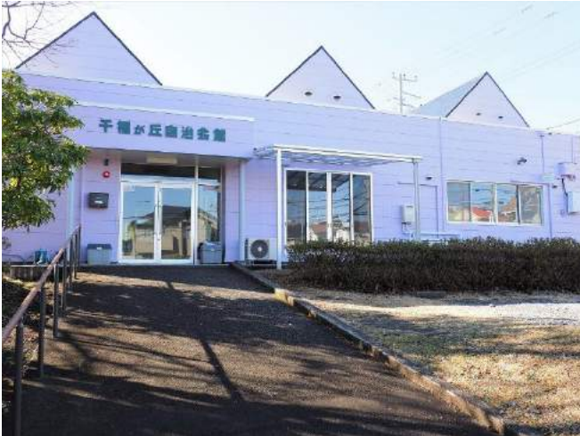
入り口横にテラスを新設

懸念されていた雨漏りについては原因が究明され、根本的な修復ができました。工事中に発覚した不具合状態であった火災報知器については交換しました。ヒビが入っていた外装の塗装も併せて実施しました。