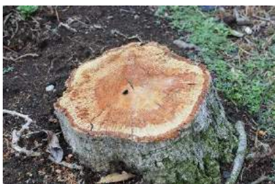
薬剤塗布された切株

今年中に結果を確認し、それを踏まえて、来年にメイン道路の木々に反映する予定です。 (自治会報9月24日参照)