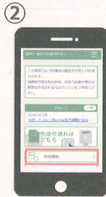
マイナンバーカード 対応のスマートフォン ※一部の端末のみ